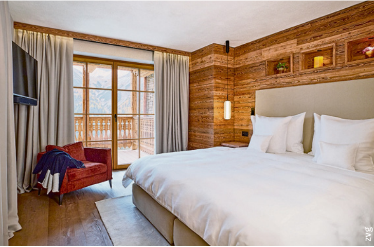
Das BelArosa Chalet bietet viel Privatsphäre, aber auch Gemeinschaftsräume wie die Kaminstube oder die Halle mit einem Leuchten-Kunstwerk.