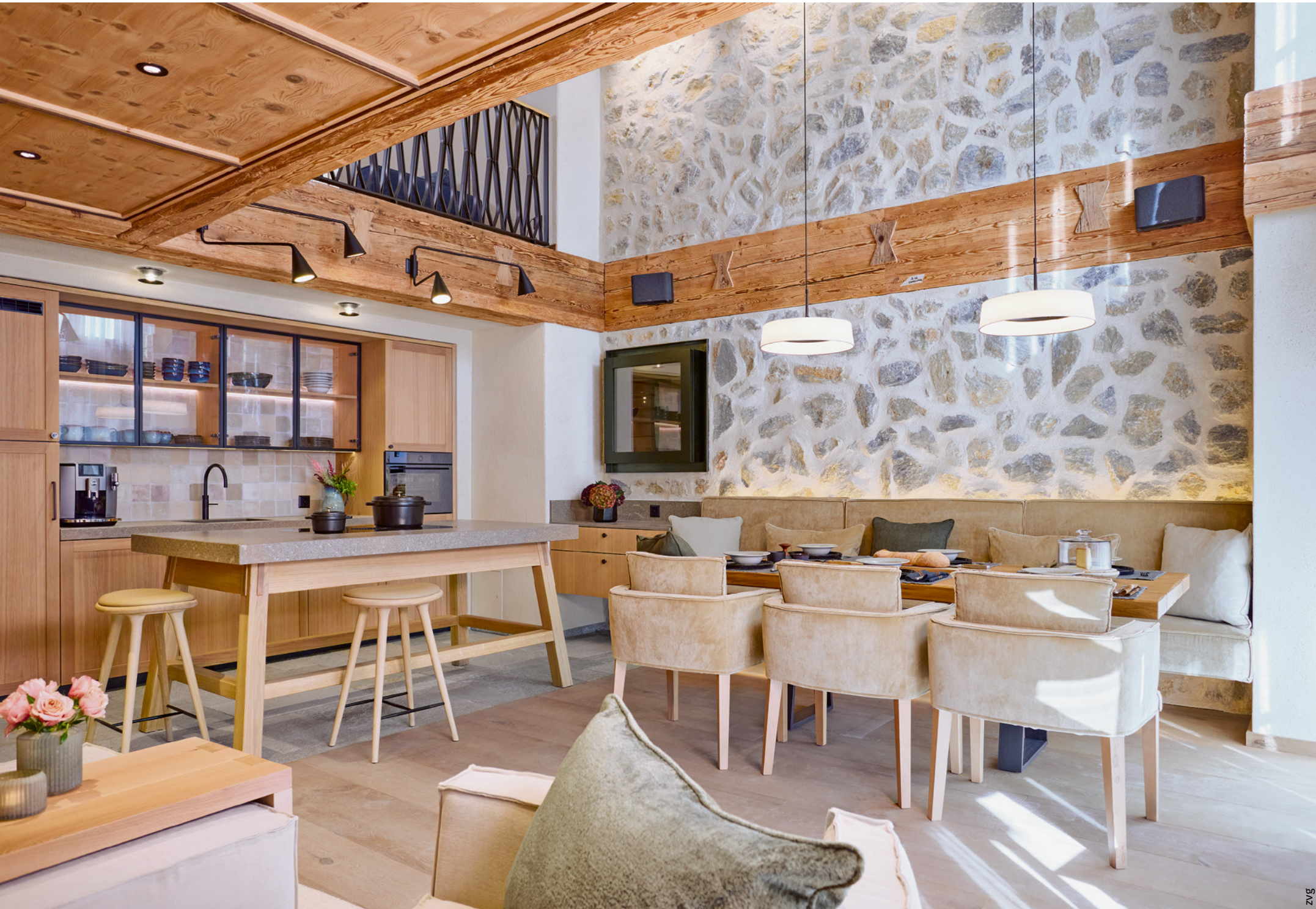
Jedes Chalet verfügt über eine komplett eingerichtete Küche mit handgemachten Kacheln, erlesenem Porzellan und gusseisernen Töpfen.