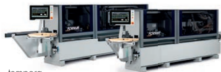
tempora F800 60.12