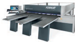
kappa automatic 80/100