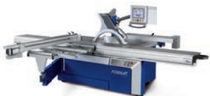
kappa 550 e-motion