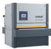
finish 1352 modular