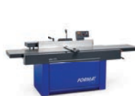
plan 51 L