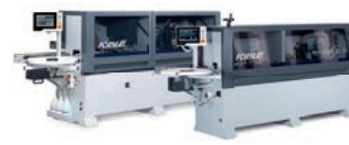
tempora F600 60.06