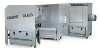
RL 200 RL 300 RL 350