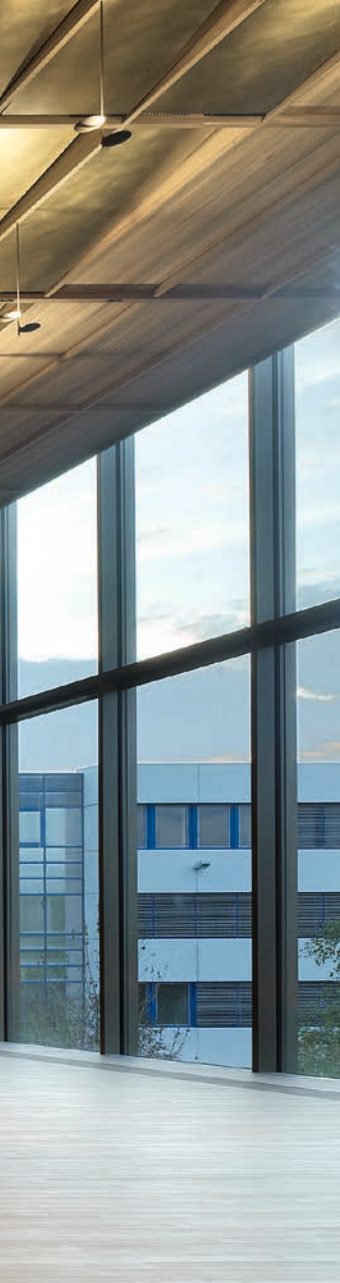
Eines von drei Auditorien im Neubau von Roche. Eindrücklich ist die Raumwirkung des Ulmenholzes.