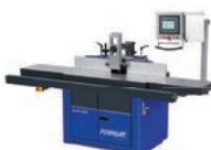
profil 45 M x-motion